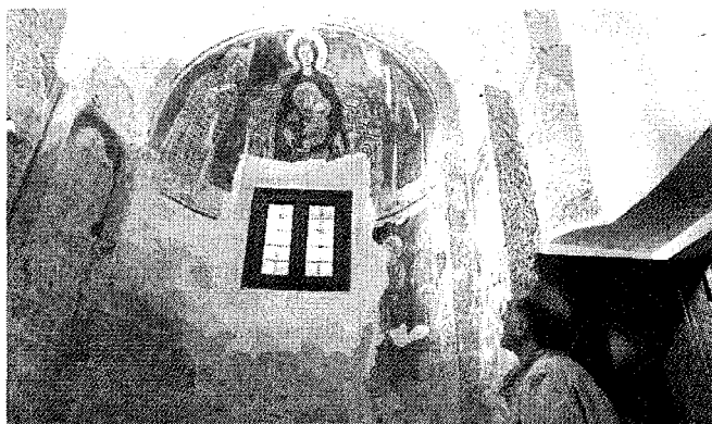
L'interno della chiesa di San Giorgio, ora trasformata in auditorium

Creati i primi 28 mediatori culturali stranieri: saranno loro ad accompagnare i gruppi di connazionali alla scoperta della «vera» Brescia